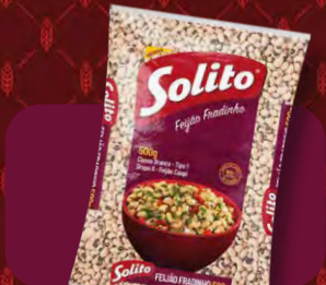
Feijão Solito Fradinho