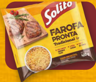
Farofa Pronta Solito Tradicional

NOVA EMBALAGEM, COM O SABOR E A QUALIDADE QUE VOCÊ JÁ CONHECE.