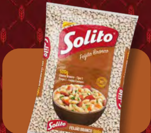
Feijão Solito Branco