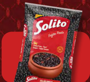
Feijão Solito Preto

PACOTE 1 KG 1 KG EMBALAGEM FARDO COM 10 UNID. FARDO COM 30 UNID.