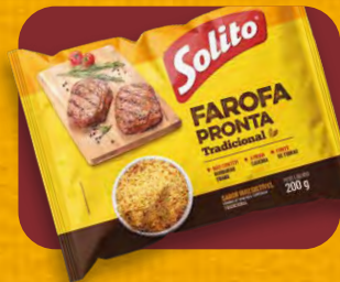
Farofa Pronta Solito Tradicional