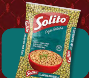
Feijão Solito Bolinha

PACOTE 500G EMBALAGEM FARDO COM 20 UNID.